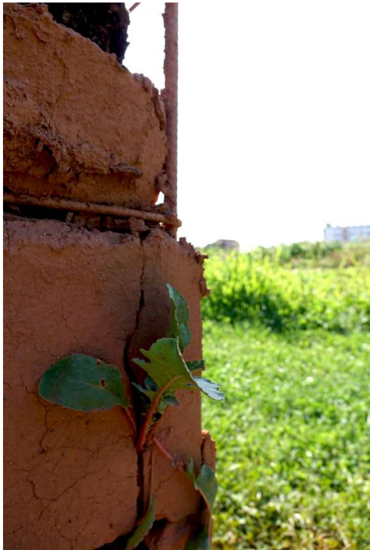
Détail de Construction structurée - 2019 Terre, terreau, graines de fèves, treillis métallique, Dimensions évolutives