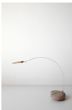
Léa Dumayet Sycomore © Léa Dumayet, courtesy galerie S.