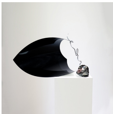
Léa Dumayet Manta