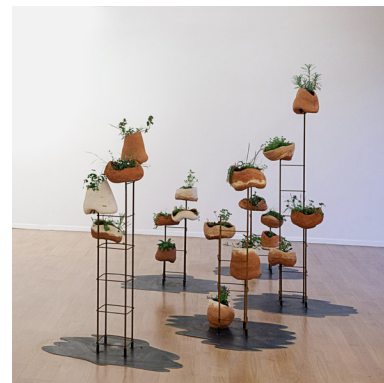
Morgane Porcheron Colonnes fragmentées - 2024 © Morgane Porcheron, courtesy galerie S.