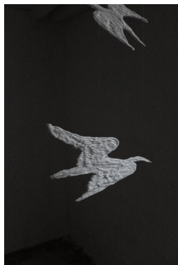
Ekaterina Costa The Cranes are Flying, 2024 (extrait de l'installation) © Ekaterina Costa, courtesy galerie S.