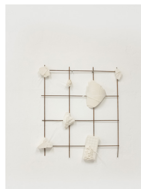
Morgane Porcheron Reperti fossili in griglia - 2023