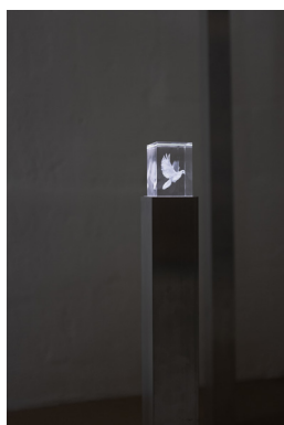
Ekaterina Costa Souvenirs de poche, 2024